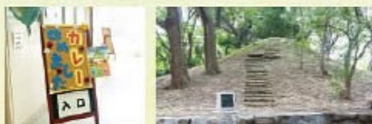
「八尾きつね山カレー」 狐山は八尾高のシンボルであり、卒業生にとって心のふるさとのようなもの。は文化祭でも販売。