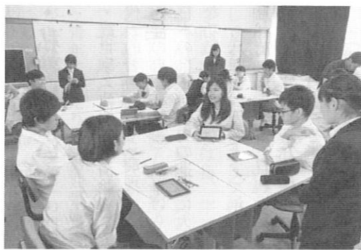
アクティブラーニング教室での授業

教室を新設して、ICT活用環境を組織的に整備しています。しかし、ICT環境構築に特別の予算があるわけではありません。普通教室のプロジェクトは創立四十周年記念事業の一環として同窓会とPTAからの資金援助(六百七十五万円)を受けて設置しました。その他の物品も前述の研究指定事業の支援を受けて設置しています。