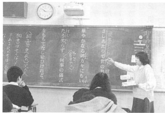
ICT環境と教室での授業

データを入れたUSBメモリを接続することができます。教員には一人一台のiPadを割り当てています。また生徒用のiPadが約百五十台あり、様々な教科において協働学習や個別学習、発表で活用しています。