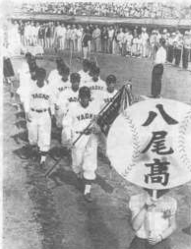
第34回全国高校野球選手権大会で入場行進する八尾の選手たち＝1952年8月13日、兵庫県西宮市の阪神甲子園球場

府立八尾高校(八尾市)の硬式野球部が1日、全国高校野球選手権大会の予選に初出場してから100年になるのを記念した催しを市内で開く。同校は1952(昭和27)年夏の第34回大会で全国準優勝したが、決勝で対戦した兵庫県立芦屋高校(同県芦屋市)の現役チームを招いた親善試合などをし、これまでの歩みを振り返る。 同部の創部年ははっきりしないが、旧制八尾中時代の1915(大正4)年に選手権大会の前身にあたる